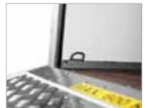
Augu fyrir festingar niðri við gólf.