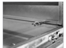
Stálbotn með innfeldum augum fyrir festingar.