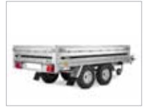
Dekkin eru undir pallinum, sem stækkar hleðsluflöt kerrunnar.