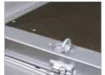
Augu fyrir festingar felld inn í sterkbyggðan stálkant.