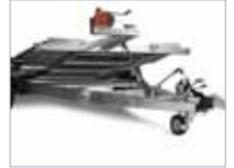
Með spili, vírum og sturtustrokki.