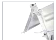
Hægt að festa afturgafflinn að ofan eða neðan.