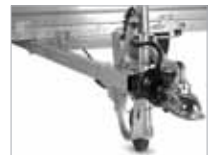
Hægt að fá með og án hemla.