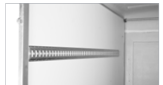
Festingar í hlið