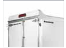
Hástæð hemlajós auka öryggið í umferðinni.