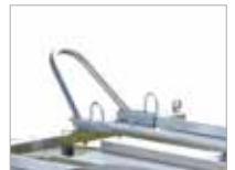
Auðvelt að festa bifhjól.