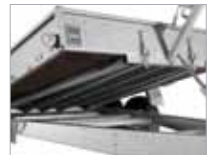
Sterkbyggð kerra með fjölda botnstífa.

Frekari upplýsingar fást á bls. 28–29 og hjá söluaðilum Brenderup.