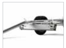
Auðvelt að færa sliskjuna milli hliða.