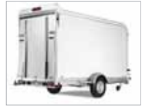
Vál um dyr eða ramp.