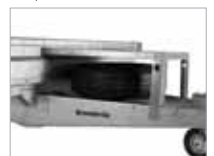
Skófluhaldari og varahjólbarði fylgja.