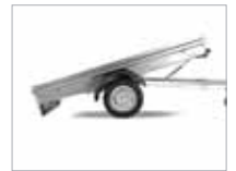
Einföld losun með sturtu.

Frekari upplýsingar fást á bls. 28–29 og hjá söluaðilum Brenderup.