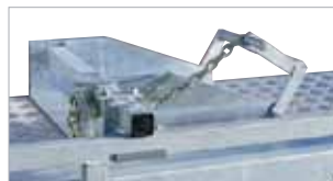
Hjólastopparar með keðju