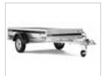
Sterk kerra með hliðarborðum úr galvaniseruðu stáli.