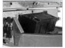
Verkfærakassi á dráttarbeyslinu.

Frekari upplýsingar fást á bls. 28–29 og hjá söluaðilum Brenderup.