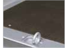
Stálkantur með innfellnum augum fyrir festingar.