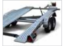
Brautir með skriðvörn.

Frekari upplýsingar fást á bls. 28–29 og hjá söluaðilum Brenderup.