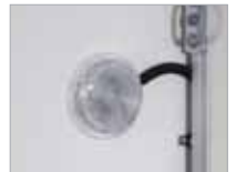
Ljós að innanverðu (nema í breiddinni 130 cm).