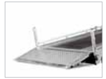
Sturta og lágstæður vagn. Auðvelt að hlaða.

Frekari upplýsingar fást á bls. 28–29 og hjá söluaðilum Brenderup.