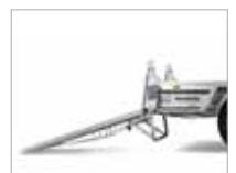
Einfalt að aka tækjum upp á pallinn með innbyggðum rampi.

Frekari upplýsingar fást á bls. 28–29 og hjá söluaðilum Brenderup.