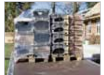
Rúmar tvö samhliða Euro-bretti.