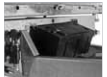
Verkfærakassi á dráttarbeyslinu.

Frekari upplýsingar fást á bls. 28–29 og hjá söluaðilum Brenderup.