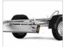
Ljósabrettið fellt niður til að auðvelda ferningu.

Frekari upplýsingar fást á bls. 28–29 og hjá söluaðilum Brenderup.