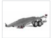
Aðeins 12° halli þegar ekið er upp á pallinn.