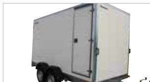
Aukadyr á hliðina