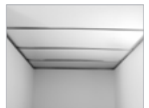
Gegnsætt og einangrað þak.

Frekari upplýsingar fást á bls. 28–29 og hjá söluaðilum Brenderup.