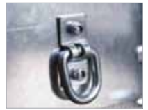
Augu fyrir festingar eru að innanverðu á völdum gerðum.