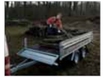
Hægt að fella framgallinn niður. Hentar vel fyrir langan farni.

Frekari upplýsingar fást á bls. 28–29 og hjá söluaðilum Brenderup.