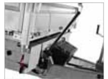
Vökvaknúin sturta er staðalbúnaður, handknúin neyðardæla.