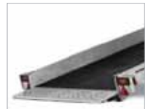
Aðeins 12° halli þegar ekið er upp á pallinn.