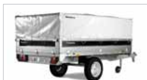
Yfirbreiðsla fyrir kerrur með net á hliðum/uppþækkun úr áli